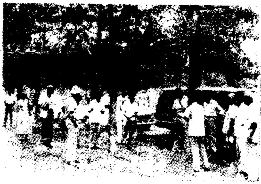
国际友人考察冠县林业时的留影